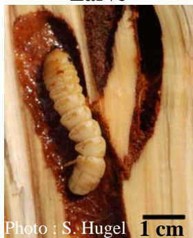
Capricorne Asiatique Larve

Comment reconnaître les larves ? Les femelles de Capricorne Asiatique ne pondent que dans du bois vivant (sur pied). Mais les larves peuvent finir leur développement dans du bois débité. Les larves et autres vers blancs (même grands) observés dans le sol ou dans le bois mort depuis plus de 2 ans ne sont pas des larves du Capricorne Asiatique mais sont probablement des larves d'espèces alsaciennes qui ne sont pas une menace (certaines sont même protégées). Les larves du Capricorne Asiatique sont difficiles à différencier des larves d'autres grands capricornes alsaciens. Dans les deux cas, elles atteignent 5 cm à maturité et sont dépourvues de pattes (même petites).