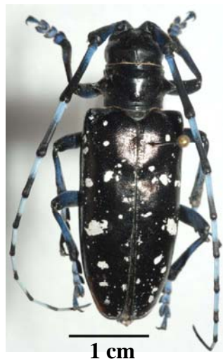
Capricorne Asiatique Adulte

Que risque-t-on en Alsace ? Un foyer très localisé de Capricorne Asiatique a été confirmé en Alsace en octobre 2008, dans le nord-est de Strasbourg (Port du Rhin). Les arbres de ce foyer ont été abattus et brûlés. Nous ne savons pas aujourd'hui si des individus ont pu se disséminer. La vigilance de tous nous permettra de détecter et d'éradiquer d'éventuels foyers secondaires.