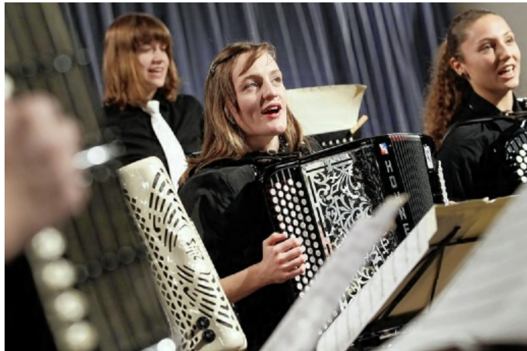
Dimanche, l'orchestre d'accordéons Staccato a joué devant une salle des fêtes comble.